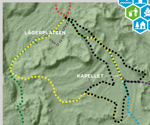
Lägerplatsen och Kapellänget

Upplev sälar på nära håll och lär dig mer om de tidigaste bosättningarna på ön. Säludden är ett sälskyddsområde men tack vare gömslet kan du komma riktigt nära utan att störa djuren.